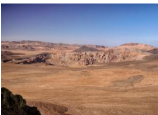
Kaza Maza 📍 - ⌚ 6h