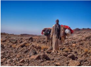
Erra Kohor 📍