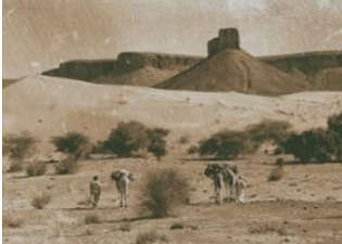
Montagne de Tibesti 📍