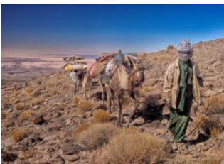
Tigui Cocoïna 📍