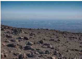
Tataï 📍 - ⌚ 7h